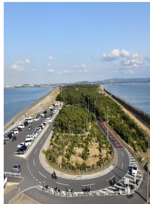
写真 富津市富津岬を展望台から臨む